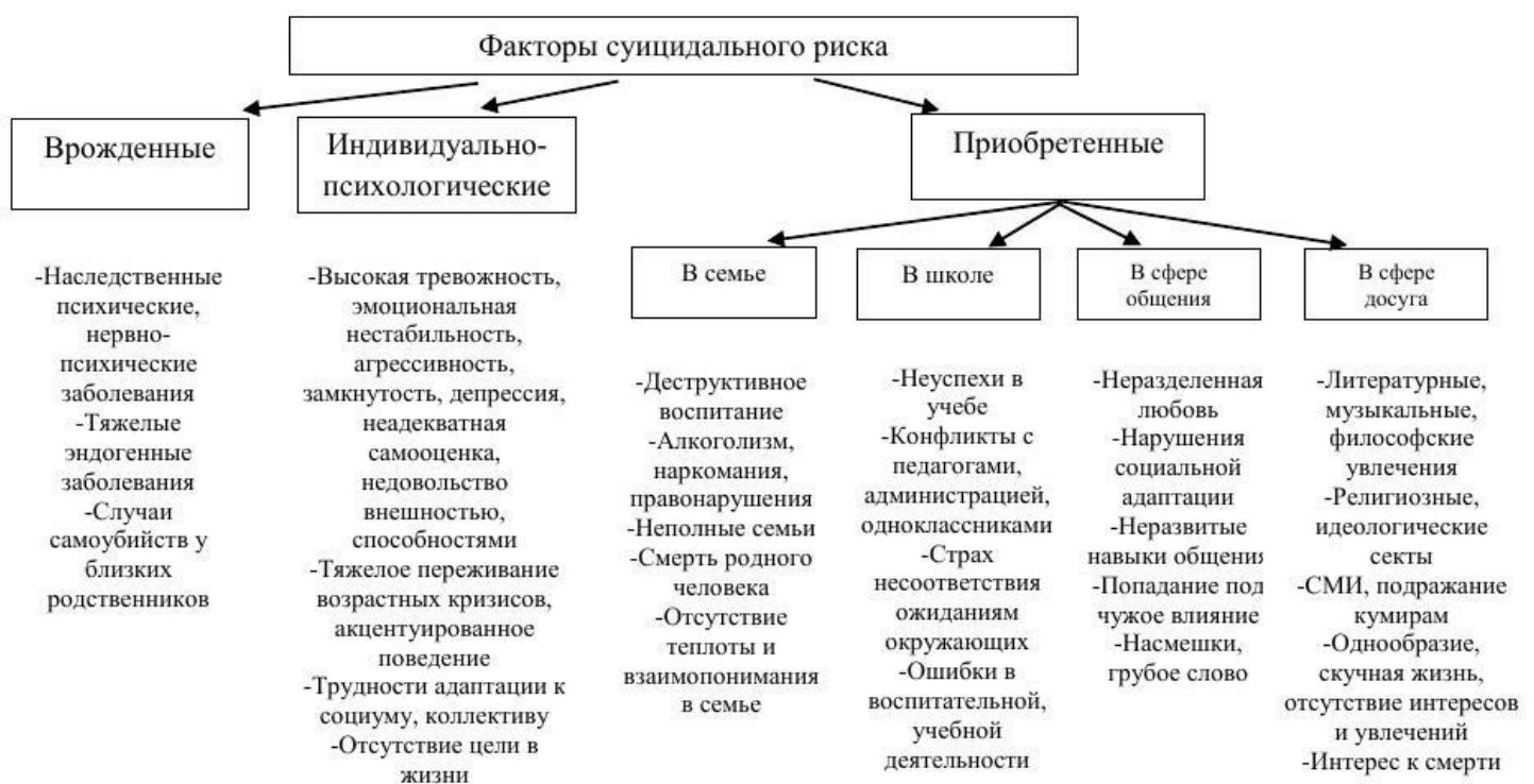
Рис.1. Факторы суицидального риска